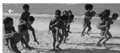
2021年4月18日曜日 20:00 UTC+09~21:30 UTC+09 あの今は今？ ～カノア保育園 20年の軌跡をたどる Online Event